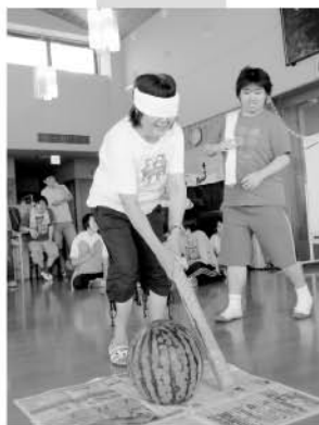
スイカ割りの後はかき氷も食べました。