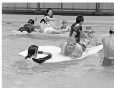
地域の小学校の協力でプールを開放して頂きました。