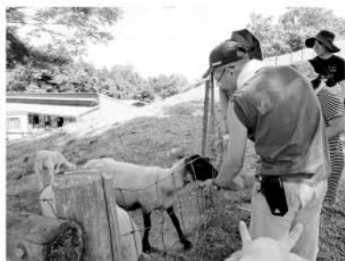
めえめえ牧場へ行きました。