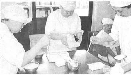
「コミュニティワークこっから」で豆腐作りに励む人たち(奈良市で)

奈良市吉町の障害者作業所「コミュニティワークこっから」に通う人たちが、宮城県産の豆乳を使った豆腐作りを続けている。豆乳は東日本震災で被災した仙台市内の豆腐店が手掛けており、メンバーは「被災地の復興支援にも役立てば