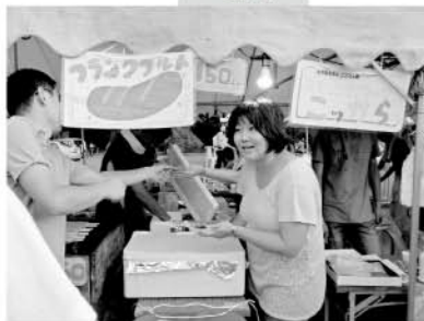
東市高円の杜夏祭りに今年も参加させていただきました。