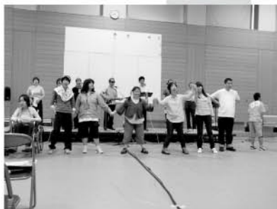
つながり祭に参加しました。