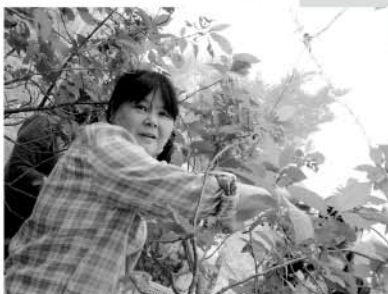
さくらんぼ狩りをさせて頂きました。