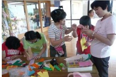
定番の輪っか作りに真剣な表情