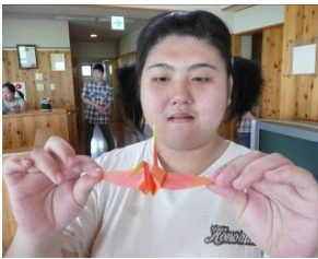
こんなに上手な折鶴も・・・