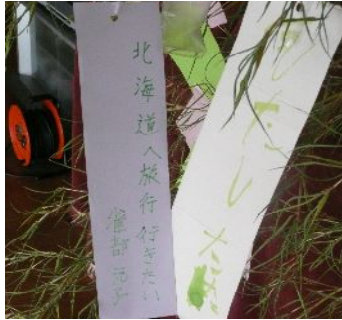
「北海道へ旅行行きたい」